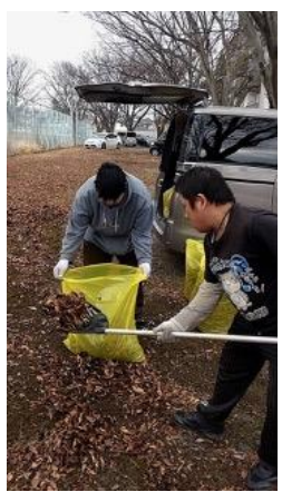
あいだいせいそう 愛大清掃

新年あけましておめでとうございます。あつという間に新しい一年がスタートしました。今年はどうな年にしたいですか？まずは大きな病いやけがをすることなく元気で過ごせることを願っています。先月は大掃除やみんなが楽しみにしていたお餅つき大会がありました。B型は久しぶりの参加ということで他事業所の利用者さんと協力して美味しいお餅を作ることができました。