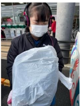
ふるぎかいしゅう 古着回収