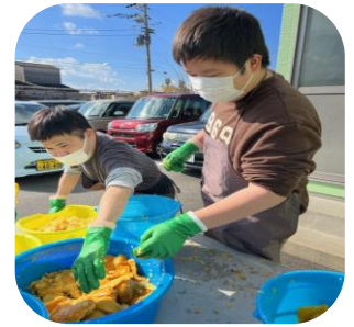
ぶんせき さきもと じゅん 文責 笹本 淳