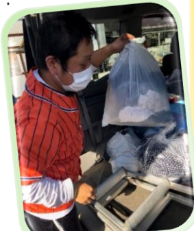
ふるぎかいしゅう 古着回収