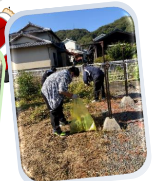
なごみホーム除草作業