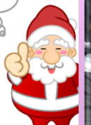
ふるぎはんばい 古着販売